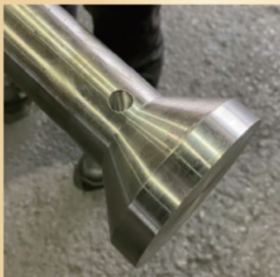
サンプル写真寸法