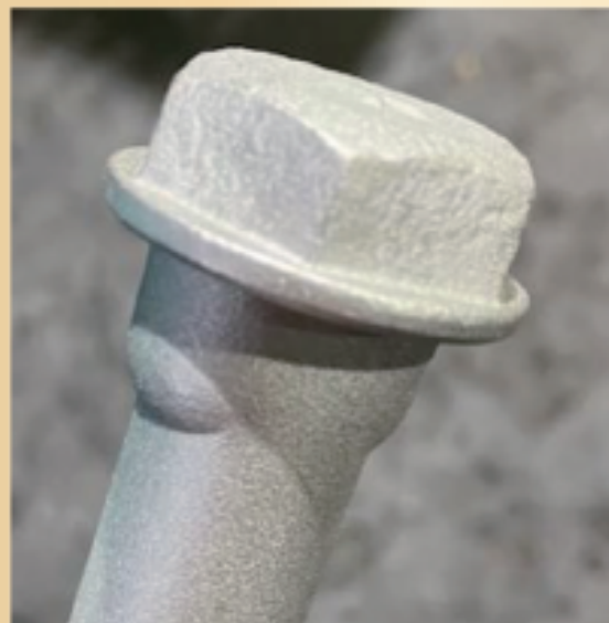
サンプル写真寸法