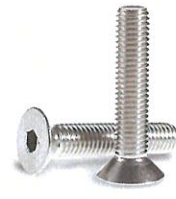
六角穴付き皿ボルト