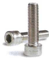
六角穴付きボルト