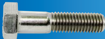
六角ボルト 316L 刻印付き