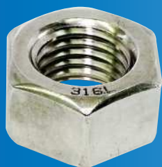
六角ナット 316L 刻印付き