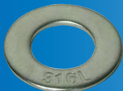
丸座金 316L 刻印付き