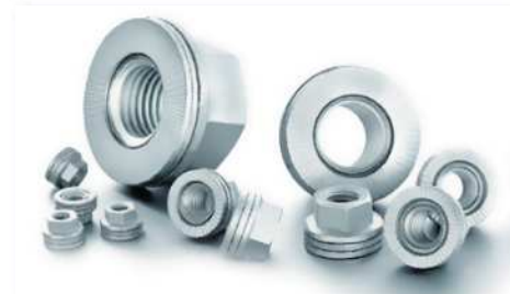
HEICO-LOCK® ウェッジロックナット