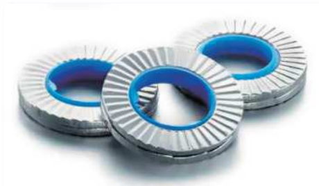
HEICO-LOCK® コンビワッシャー