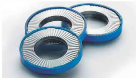
HEICO-LOCK® リングロックワッシャー