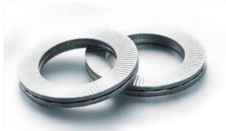
HEICO-LOCK® ウェッジロックワッシャー