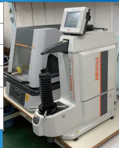
(左) 蛍光X線式測定機 (右) ロックウェル硬さ試験機