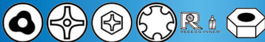
トライクル 十字ピン ノーリセス システム5 リセスインナー いたずら防止ナット