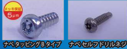
ナベタッピングBタイプ