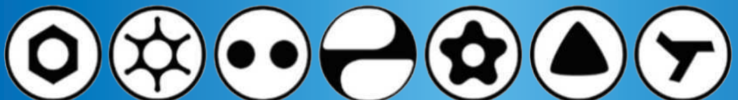
ピン付き六角穴 ピン付き6-ロブ ツー・ホール ワンサイド 5-ロブ梅花 えぼしロック トライウイング