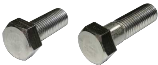
ステンレス六角ボルト