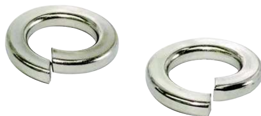
ステンレスバネ座金