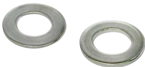
ステンレス丸座金