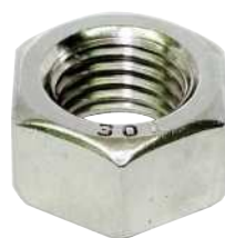
ステンレスホーマーナット