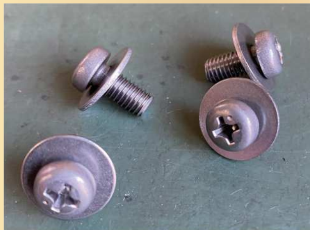
左ねじ 特寸平座付鍋セムス