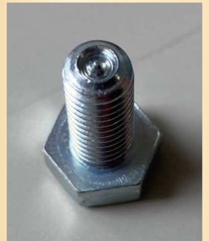
六角ボルト Wポイント仕様の 切削加工品

ヘッダー加工、ヘッダー加工 + 切削加工など コスト低減、納期短縮を考えてみませんか？